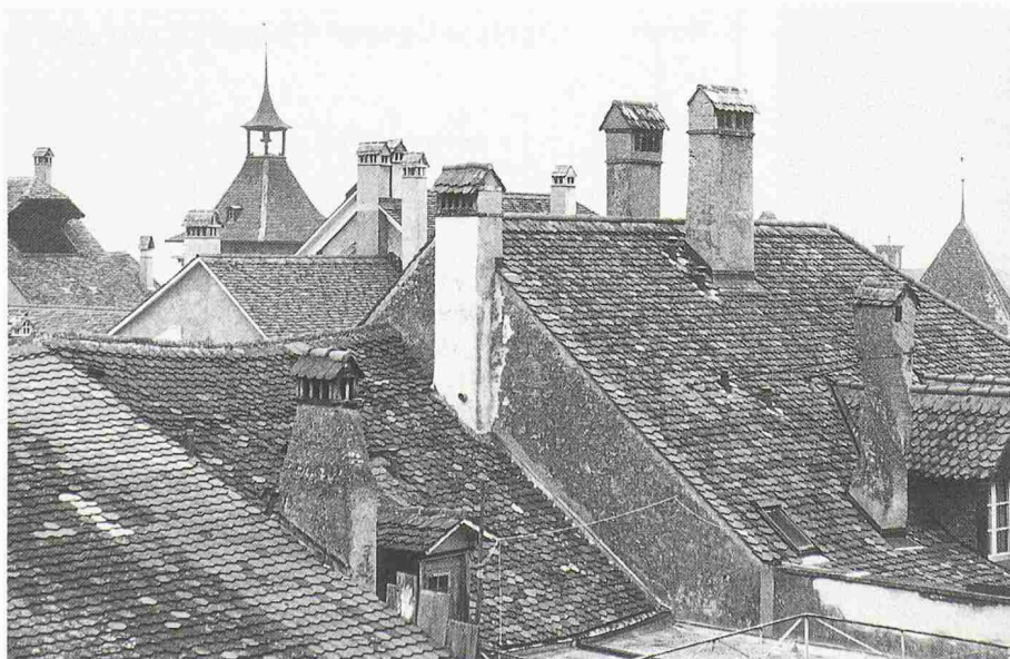
Ziegelwaren werden in unserem Land seit der Römerzeit verwendet. Ein Blick auf eine Dachlandschaft genügt, um sich der Bedeutung der Baukeramik bewusst zu werden

Architekten und Gemeinden, die den Ordner bisher nicht erhalten haben, können Gratisexemplare anfordern bei: Schweizerische Fachstelle für behindertengerechtes Bauen, Neugasse 136, 8005 Zürich.