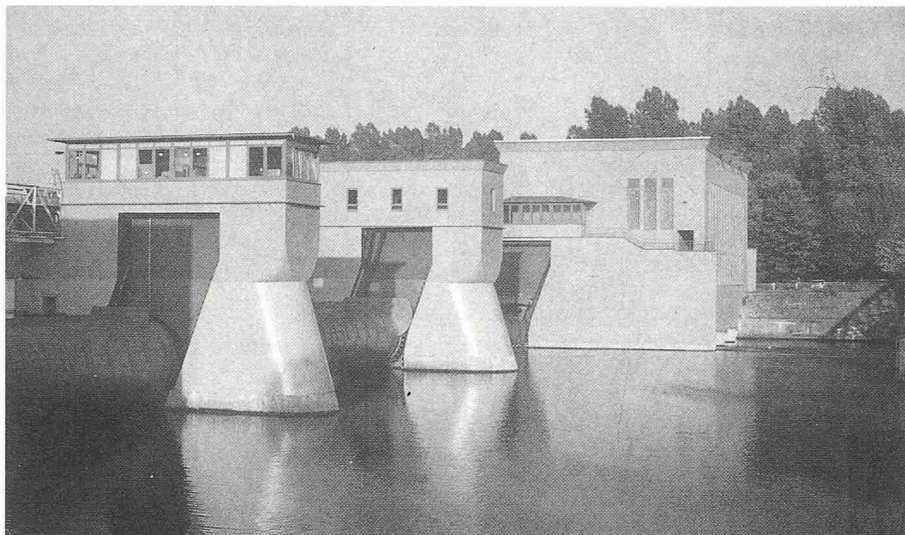
Bild 2. Wehranlage am Hengsteysee nach Sanierung der Wehrpfeiler mit Nassspritzmörtel - angeliefert als Werk trockenmörtel (Sager)