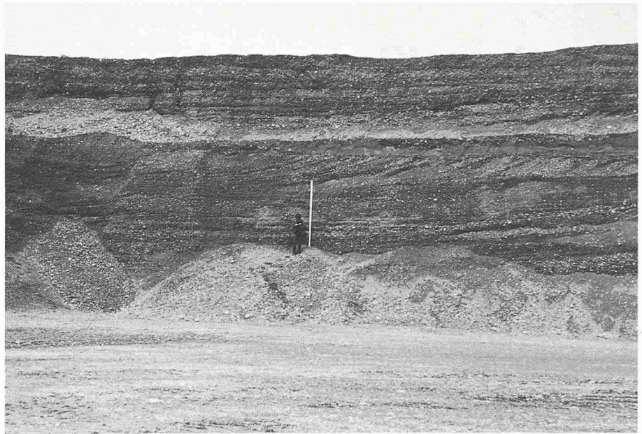
Bild 2. An der Wand einer Kiesgrube werden die Inhomogenitäten der Grundwasserträger aufgeschlossen