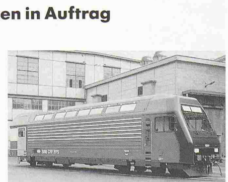
S-Bahn-Lokomotive Re 4/4 V der SBB