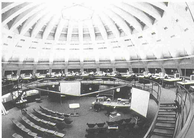
Bild 1. Das CAETH-Zentrum der ETH Zürich

Sämtliche Industrieländer unternehmen zur Zeit grösste Anstrengungen, um auf diesem Gebiet Fortschritte zur Verbesserung der Konkurrenzfähigkeit ihrer Industrie zu machen. CIM ist nicht nur anwendbar für Grossunter-