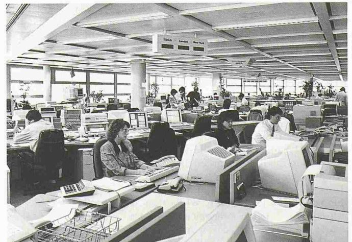
Im neuen Gebäude untergebracht: Börsenhandelsraum der SBG