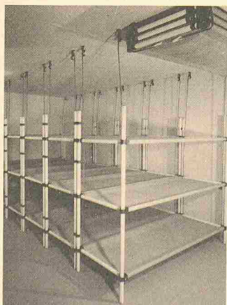
Ubag-Schutzraumliege: hängende Deckenkonstruktion

Die Ubag-Schutzraumliege kann in Friedenszeiten oder tagsüber bei Alarmzustand auf einfachste Weise hochgezogen und an der Decke befestigt werden. Dadurch wird zusätzlich