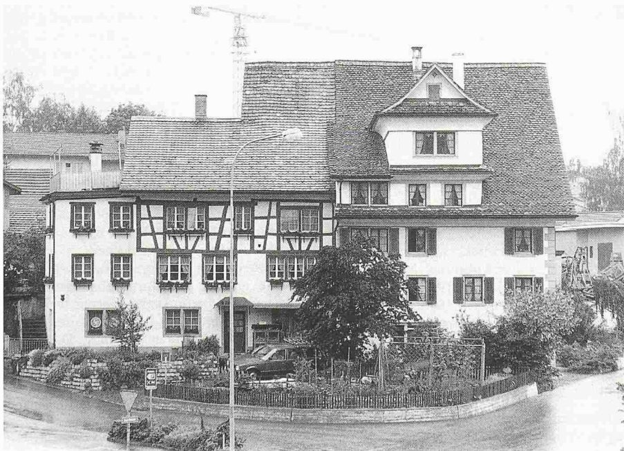
Seit 1981 statistisch belegt: Der Trend «aufs Land» hält an. Die Wohnbevölkerung in ländlichen Gemeinden wächst deutlich stärker als in den Städten. Sicherlich trägt dazu bei, dass in diesen Gemeinden immer mehr Wohnraum durch Umnutzungen und Sanierungen geschaffen wird

Die Kantone Schwyz (1,7%), Thurgau und Genf (je 1,6%) verzeichneten die grössten prozentualen Bevölkerungszunahmen, die deutlich über dem Schweizer Mittel von 0,8% liegen. Als einziger Kanton hatte Basel-Stadt einen Rückgang der Wohnbevölkerung (-0,9%) zu verbuchen.