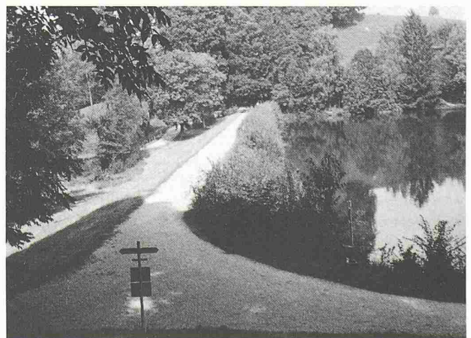
Im Norden und im Westen wird der Gübensee von Dämmen abgeschlossen. Um die Standfestigkeit und Dichtigkeit zu gewährleisten, mussten die inzwischen grossgewachsenen Bäume entfernt werden. In der Mitte der Dämme (unter dem Weg) wurde eine 2,5 m tiefe Beton-Trennwand eingelassen, um die Dämme abzudichten (im Bild: der Westdamm)