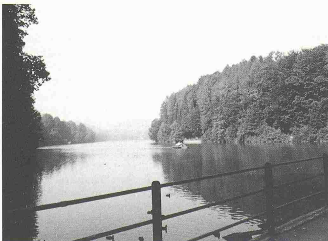
Blick von der Staumauer auf den unweit von St. Gallen gelegenen Gübensee, der seit der Jahrhundertwende existiert. Obwohl ein künstliches Gewässer, steht der kleine See mit seinen reizvollen Uferpartien und der reichen Vogelwelt seit Jahrzehnten unter Naturschutz

Bestandteil dieses zwischen 1898 und 1900 realisierten ersten Hochdruckwerkes der Schweiz ist der zugehörige, knapp 100 m höher liegende Gübensee, dessen Wasser das Werk speist, und der heute mit seinen ausgebauten Uferwegen und der Vielfalt von Wasservögeln zu den bevorzugten Naherholungsgebieten der St. Galler gehört. Was viele Besucher, die am Abend oder an Wochenenden auf den gut ausgebauten Uferwegen wandern, nicht wissen: Vor der Jahrhundertwende gab es den Gübensee noch gar nicht; er ist ein seinerzeit ausschliesslich für die Stromerzeugung geschaffenes künstliches Gewässer. Durch eine 23 m hohe Stau-mauer im Osten sowie zwei Erddämme im Norden und Westen begrenzt, bedeckt er mit seinen 17 ha Fläche und einem Inhalt von 1,5 Mio. m 3 das ehemalige Gübensee.