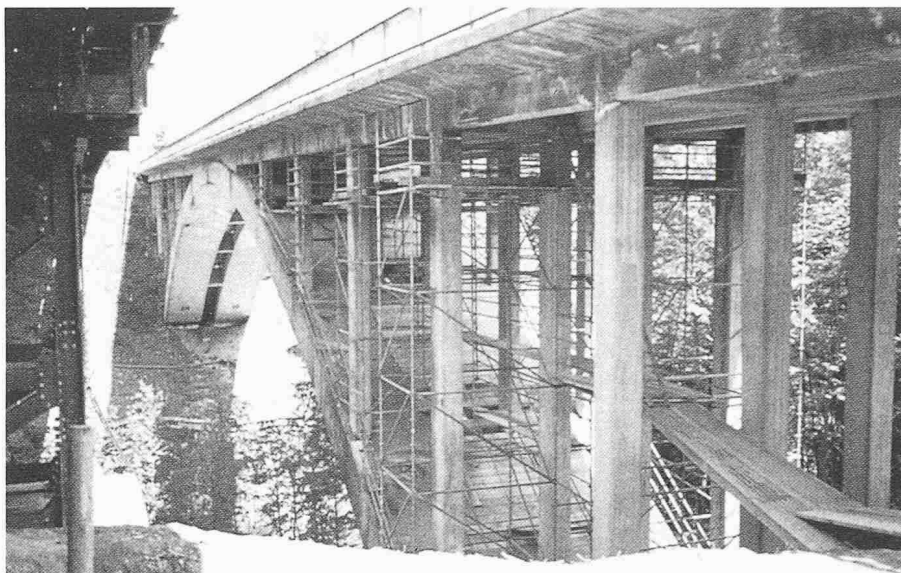
Bild 3. Die mit Spritzbeton instandgesetzte Echelsbacher Bogenbrücke erhält als Oberflächenschutz eine Beschichtung (7000 m 2 ) mit zementgebundener Dichtungsschlämme ( Weiss )

Dipl.-Ing. K. Gerlich , München, hat die Anforderungen an flexible Dichtungsschlämme (FDS) als Oberflächenschutz von Beton für den Einsatz im Tunnel- und Brückenbau bei der Deut-