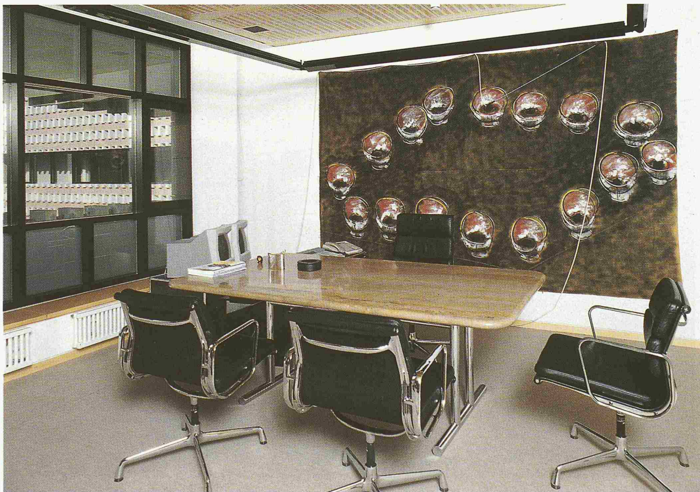
Dominierend in einem Direktionsbüro: die «Tazze die Torino» von Mario Merz