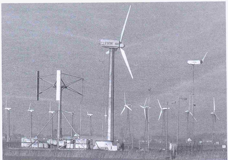
Windtestfeld im Kaiser-Wilhelm-Koog

Ausserdem werden dort im Rahmen von BMFT-Projekten Windkraftanlagen für den Einsatz in der Bundesrepublik, in Ländern der dritten Welt und in der Antarktis getestet. Die Ergebnisse sollen auch für die im Rahmen der für die Errichtung von Windkraftanlagen erforderlichen Baugenehmigungen herangezogen werden, um diese in Zukunft zügiger abwickeln zu können.