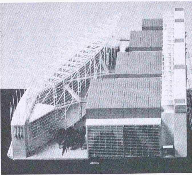
Forum International de Tokyo, 1er prix: Rafael Vinoly, USA