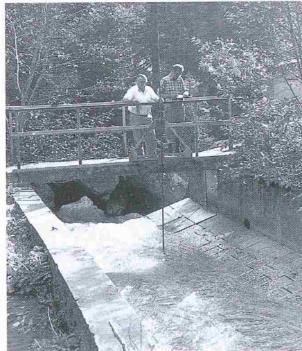
Bild 1. Flügelmessung Alpbach-Erstfeld, Bodenberg

Bei der Integrationsmethode wird dem zu messenden Fliessgewässer eine be-