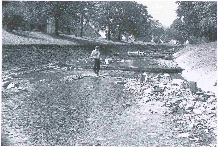
Bild 4. Messstrecke Chli Schliere-Alpnach, Chilch Erli am 21. September 1989