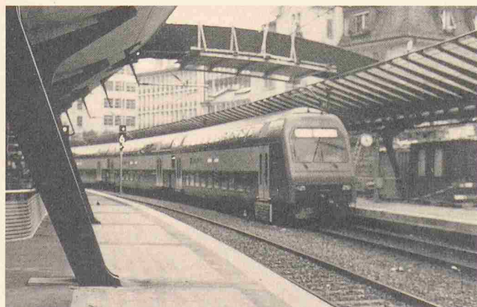
Zürcher S-Bahn (Bahnhof Stadelhofen): Sika-Konzepte im Einsatz

schiedenste Problemlösungen zeigten die Sika-Kompetenz auch während des Baus der Zürcher S-Bahn. Als Partner von Projektierenden und Unternehmen war die Firma bei der Beratung für verschiedenste Betonkonzepte bis hin zu gezielt eingesetzten Mörtel- und Fugendichtsystemen präsent. Stellvertretend sind nachfolgend drei Beispiele erläutert, welche bei der Erweiterung des Bahnhof Stadelhofen ausgeführt wurden.