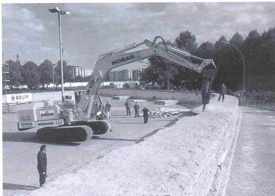
Viele Schaulustige hatten sich unter den Bäumen im Hintergrund eingefunden, als der Abbruch der Panzersperrmauer um das Brandenburger Tor begann – symbolträchtig mit einem aus Ost und West zusammengesetzten Gerät

Für den Mauerabbruch werden Geräte aus Ost und West gemeinsam eingesetzt: Ausschlaggebend für die Auswahl des DDR-Baggers und der Hydraulikhämmer aus der BRD war neben Leistungsfähigkeit und Zuverlässigkeit die hohe Wirtschaftlichkeit. Dass beide Geräte zu einer Einheit vereint wurden, hat sicher auch Symbolkraft für Deutschlands Zukunft.