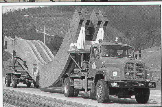
Unser Spezialfahrzeug, beladen mit den Hauptbogensägern, unterwegs nach Neuchâtel. Der Transport von Holzkonstruktionen ist auch über weite Strecken wirtschaftlich.