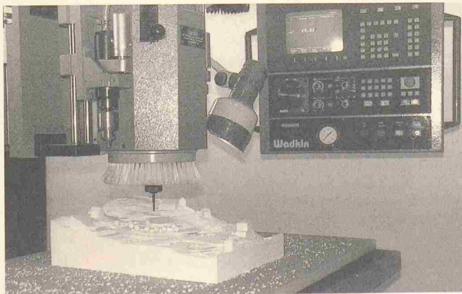
Modellerstellung durch NC-gesteuerte Fräsmaschine ab mittels CAD erstellter Zeichnung