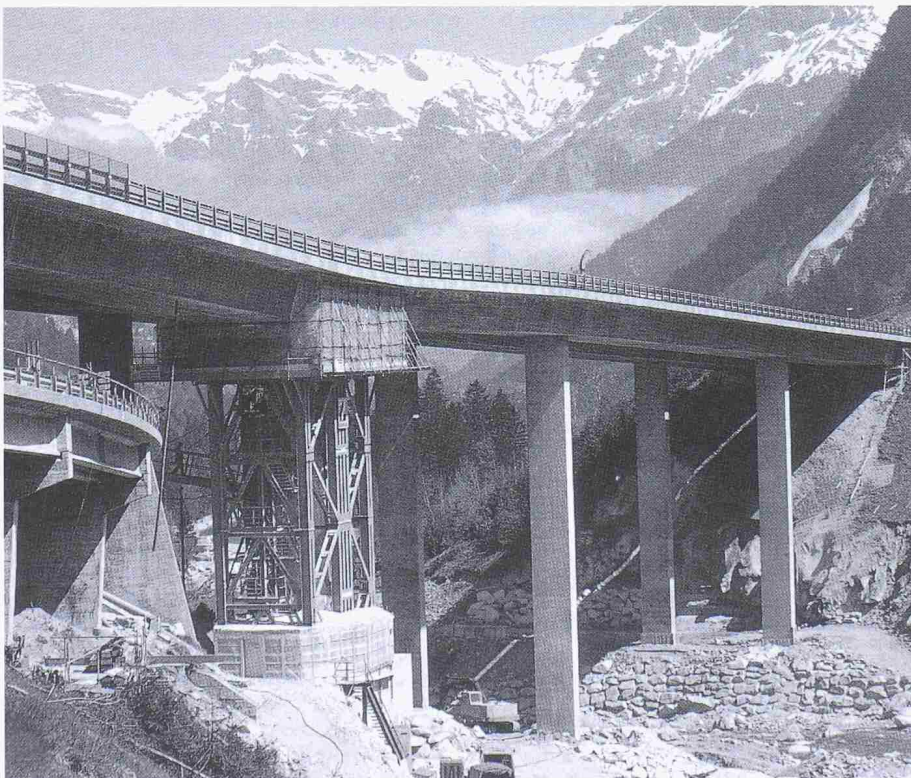
Wiederinstandstellung der Brücke Wassen der Gotthard-Autobahn N2 nach der Hochwasserkatastrophe 1987 – ein aufwendiges Rekonstruktionsobjekt von verkehrspolitisch grosser Bedeutung

Die 90er Jahre werden geprägt durch den Anpassungsdruck an Europa, unabhängig davon, ob die Schweiz der EG beiträgt, sich für den EWR entscheidet oder den Alleingang wählt. Was den Bau anbetrifft, ist allerdings ein Nichtbeitritt zur EG nach Ansicht der SBI – was im Bericht ihres Präsidenten, Architekt P.J. Hünerwadel , Basel, zum Ausdruck kommt – die kleinste Sorge. Bauobjekte bleiben nach wie vor Einzel-