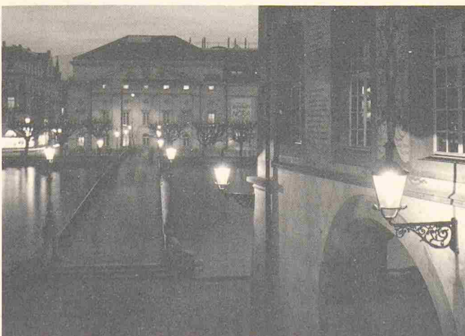
Das Gasthaus Pfistern in der Luzerner Altstadt in neuem Licht. Die zwei Leuchten rechts sind mit SDW-T bestückt. Ihr Licht harmonisiert mit der Glühlampenbeleuchtung der Reussbrücke.

und 100 Watt gibt, bietet Philips nun eine Alternative an. Die natürliche Farbwiedergabe durch ein breites Farbenspektrum ohne störende Blendung und eine angenehme, warme Lichtfarbe sollen traditionsreichen