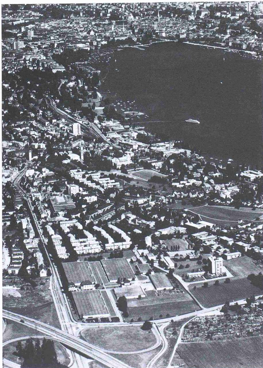
Im Vordergrund in Bildmitte erkennt man die grossen Dachflächen des Seewasserwerkes Moos in Zürich-Wollishofen. Hier plant das EWZ eine Sonnenenergie-Anlage

sern pro Jahr rund 500 000 kWh Strom erzeugen, was dem Jahresbedarf von 120 Haushaltungen entspricht. Von der Anlage verspricht man sich auch neue Erfahrungen in der Anwendung von Solarenergie. Die Baubewilligung wird für 1991 erwartet.