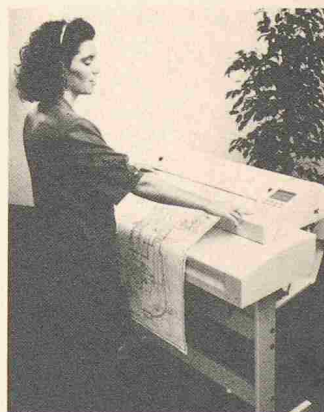
Der «Megafax» übermittelt Formate bis A1

Der Megafax verfügt über einen Fine-Auflösungsmodus, einen Fehler-Report und 16 Grautöne. Somit eignet sich das Gerät auch für die Übermittlung von Illustrationen. Eine 100-Meter-Papierrolle und ein Kurzwahlspeicher für 90 Telefonnummern komplettieren diesen Telefax. Zeitverzögerte Übermittlungen, Übertragungsgeschwindigkeit 9600 bps, automatische Wahl des besten Übertragungsmodus je nach Leitungsqualität, die