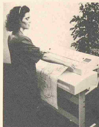
Der «Megafax» übermittelt Formate bis A1

Der Megafax verfügt über einen Fine-Auflösungsmodus, einen Fehler-Report und 16 Grautöne. Somit eignet sich das Gerät auch für die Übermittlung von Illustrationen. Eine 100-Meter-Papierrolle und ein Kurzwahlspeicher für 90 Telefonnummern komplettieren diesen Telefax. Zeitverzögerte Übermittlungen, Übertragungsgeschwindigkeit 9600 bps, automatische Wahl des besten Übertragungsmodus je nach Leitungsqualität, die