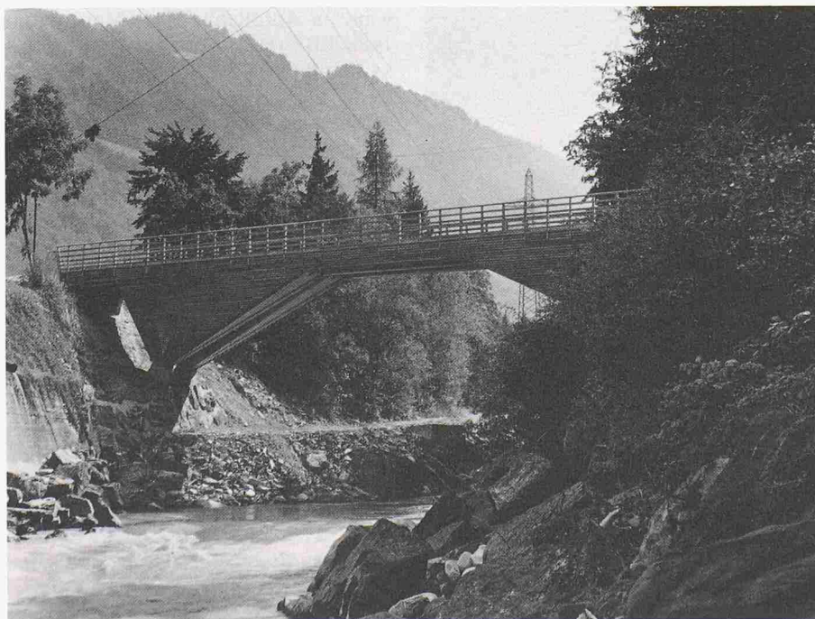
«Sagastäg»-Brücke über die Landquart

Die Erstellung der «Sagastäg»-Brücke über die Landquart bei Schiers ist ein Pilotprojekt des Impulsprogrammes Holz. Sie zeigt, dass Bergholz durchaus auch höherwertig verarbeitet werden kann. Sie ist darüber hinaus ein weiteres bemerkenswertes Beispiel des modernen Holzbrückenbaus.