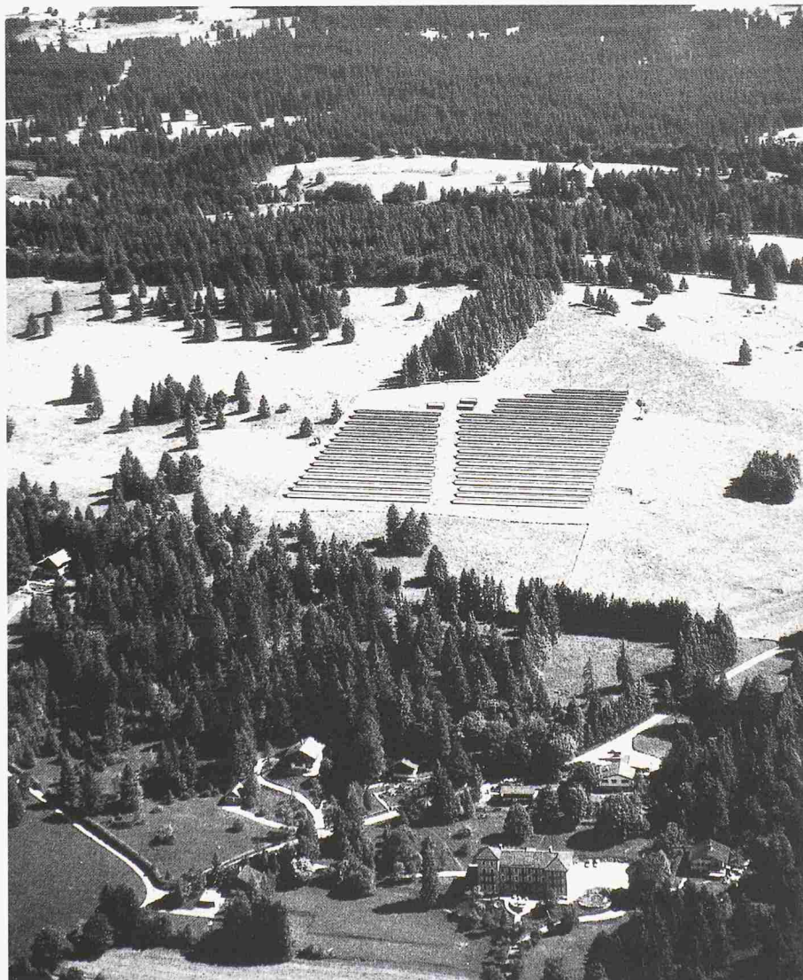
Bild 3. Mit 500 kW Leistung ist «Mont Soleil» im Jura das grösste Solarkraftwerk Europas. 4000 m 2 Solarzellen werden ab Herbst 1991 voraussichtlich jährlich rund 700 000 kWh Sonnenstrom liefern.