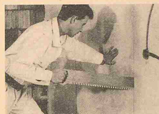
Nachträglicher Türeinstbau in eine Alba-Trennwand

Beim Alba-System stimmt auch der ökonomische Aspekt. Dies zeigt sich einerseits in den Gestaltungsmöglichkeiten, die dem Planer bei der Raumaufteilung offenstehen und nachträgliche Korrekturen erlauben. Es zeigt sich aber auch bei der durch die Eigenschaften des Materials Gips bewirkten Wohnbehaglichkeit. Und drittens wird dies auch bewiesen in den technischen Daten wie Schallschutz bis 56 Dezibel, Brandschutz bis F 240 und dem günstigen Gewicht ab 54 kg pro Quadratmeter.