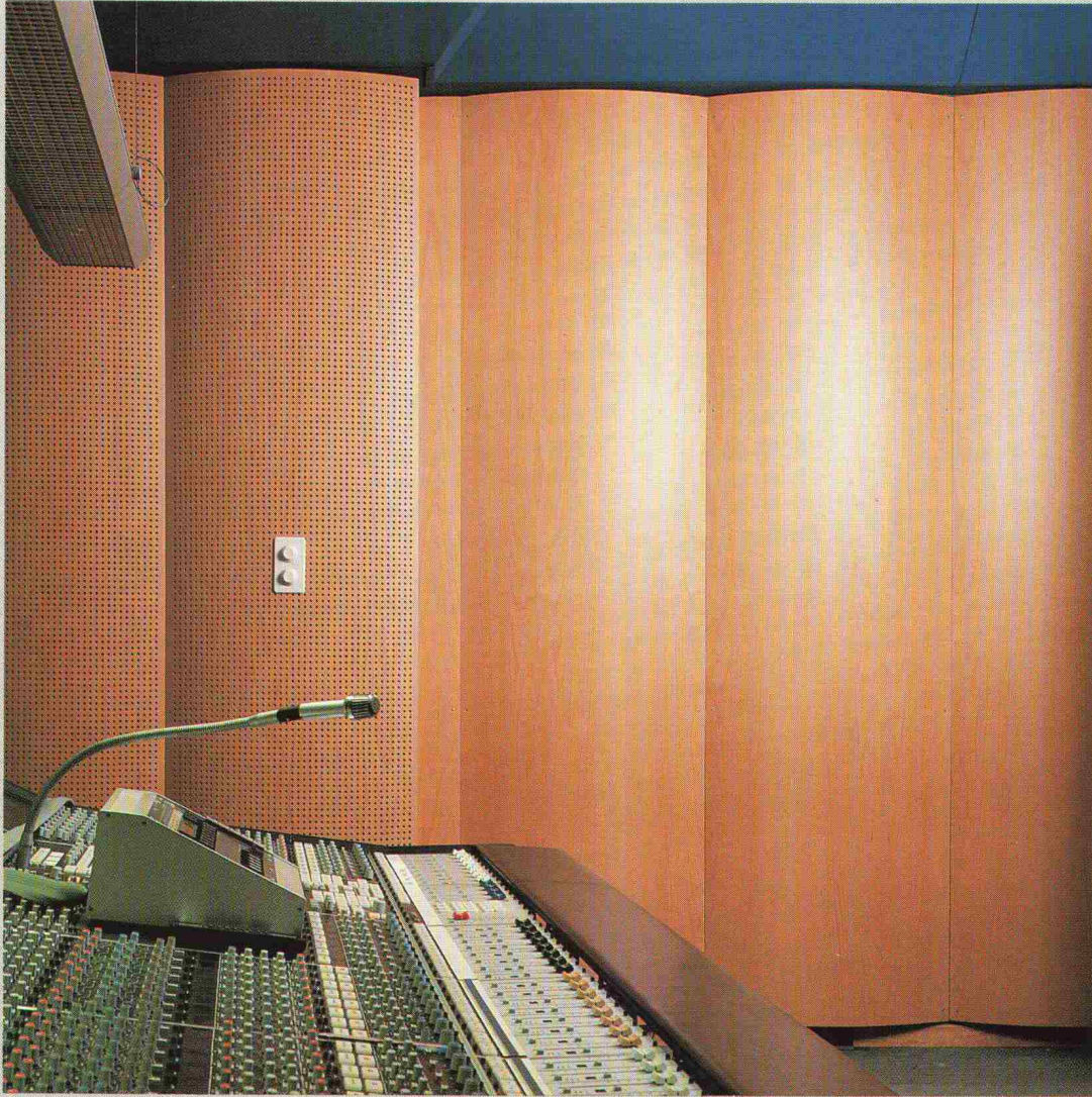
Verkleidungen für spezielle Akustik.