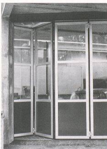
Alu-Falttorfront einer Servicegarage: Unterhaltsarme Bauweise, rasches Öffnen, gute Wärmedämmung, lange Lebensdauer

Natürlich weist jede Torart ganz spezifische Vor- und Nachteile auf (siehe Ver-