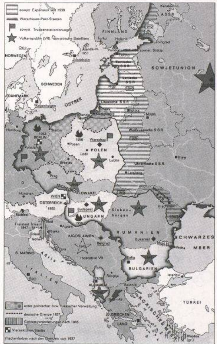
Bild 3. Das sowjetische Satellitensystem in Europa nach 1945