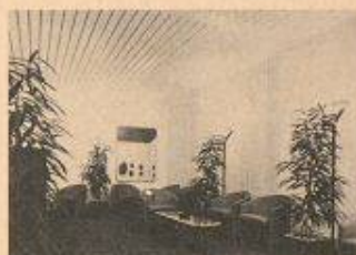
Hesco zeigt Lüftungs- und Klimatechnik

Hesco Pilgersteg AG 8630 Rütli Halle 5, Stand 226