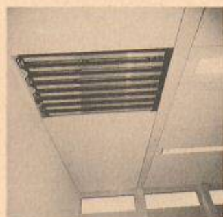
Die Flexi-Cool-Kühldeckensysteme von ABB Fläkt AG erbringen hohe Kühlleistungen bei niedrigen Investitions- und Betriebskosten.

Der Stand soll dem Besucher den Einfluss des richtigen Raumklimas auf den Menschen wirkungsvoll demonstrieren. Dass dabei die heutigen Anforderungen im Umgang mit Energie und Umwelt nicht vergessen werden, ist ein weiteres zentrales Thema des ABB-Standes. Energiesparende Anlage und die Verwendung von umweltfreundlichen Materialien ist für ABB eine Selbstverständlichkeit. An der Hilsa werden Produkte und Lösungen für die wirtschaftliche Lüftung und Klimatisierung bei vertretbarem Investitionsaufwand und minimalen Betriebs- und Wartungskosten angeboten.