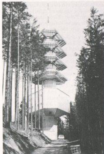
Die Richtfunkanlage Höhrnonen, vorerst als Provisorium in Betrieb

Der rasante technische Wandel führte inzwischen zu einem neuen Netzkonzept unter ausschliesslichem Einsatz von Übertragungsausrüstungen einer neuen Generation, welche mehr Kapazität und Übertragungssicherheit bietet, wirtschaftlicher zu betreiben und technisch europakompatibel ist. Da diese Übertragungssysteme aber erst ab 1993 verfügbar sind, hat die PTT beschlossen, auf den weiteren Ausbau mit heutiger Technik zu verzichten und Höhrnonen 1993/94 mit Geräten modernster Technologie in Betrieb zu nehmen. Die Sicherheit während der Übergangszeit bleibt aber durch die Provisorien gewährleistet.