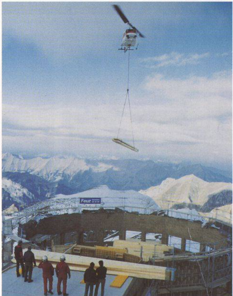
Bild 1. Deckenkonstruktion Touristorama Schilthorn, unsere höchste Baustelle mit entsprechenden Transportmitteln