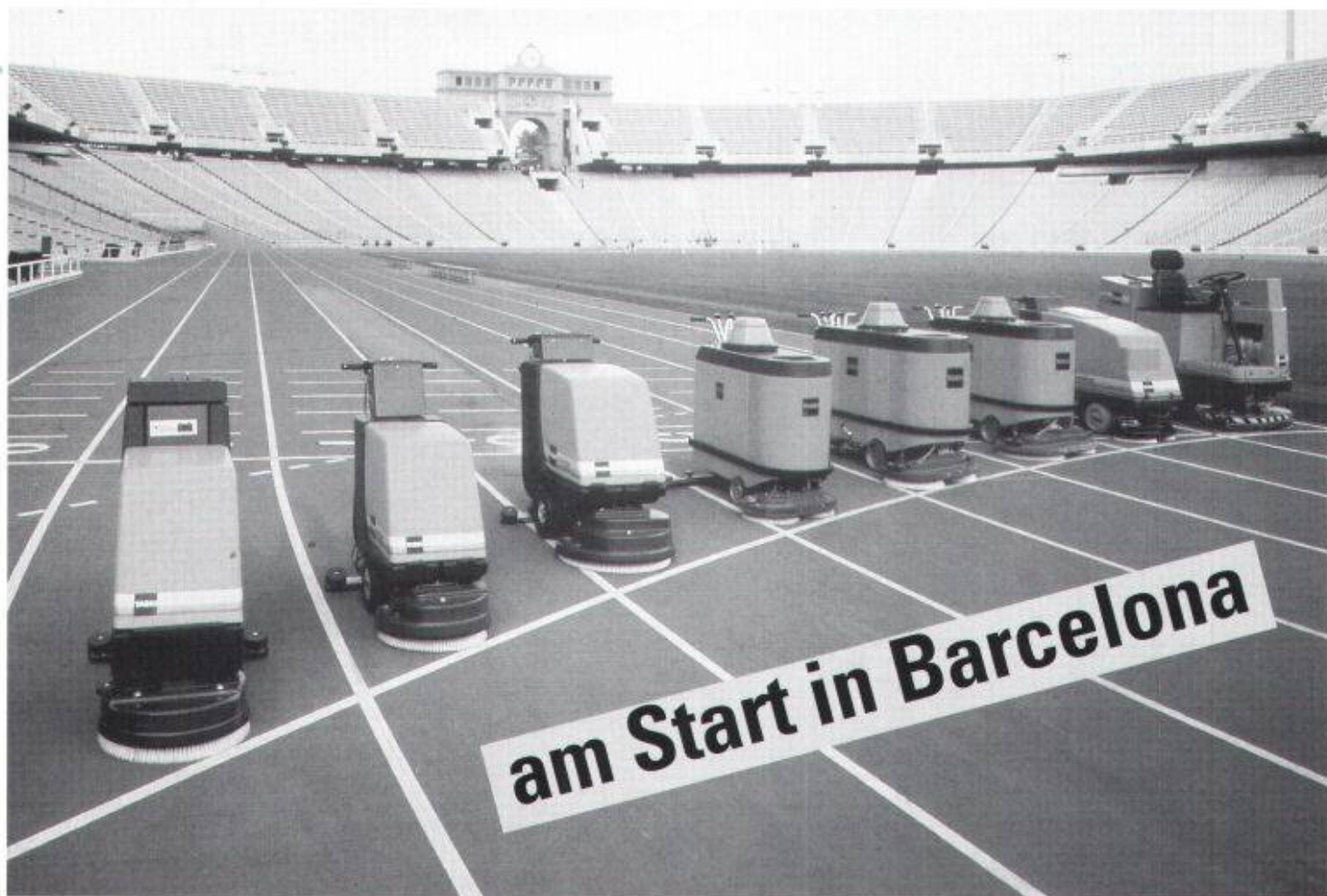
Die Sporthalle Sant-Jordi und das Olympia-Stadion werden mit TASKI Material gereinigt.

Wenn die besten Sportler der Welt in Barcelona um Olympisches Gold kämpfen, geht auch TASKI an den Start. Mit einer erstklassigen Putzstaffel sorgt der Marktleader im Olympia-Stadion und in der Sant-Jordi-Sporthalle für saubere Spiele. Angeführt wird die TASKI Olympia-Delegation vom combimat 4000 (Bild) mit seinem rekordverdächtigen Putzleistungs-