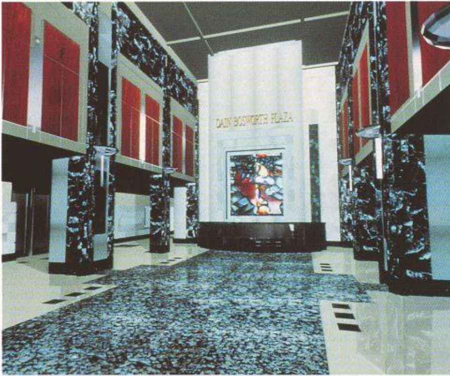
Bild 3. Erst das Zusammenspiel vieler Funktionen (Strukturen, Spiegelung, Beleuchtung usw.) erzeugt ein realistisches Bild einer Architektur

es auch sehr leicht möglich sein, in ein bestehendes Volumen neue Flächen, Kanten oder Punkte interaktiv einzusetzen oder diese zu entfernen.