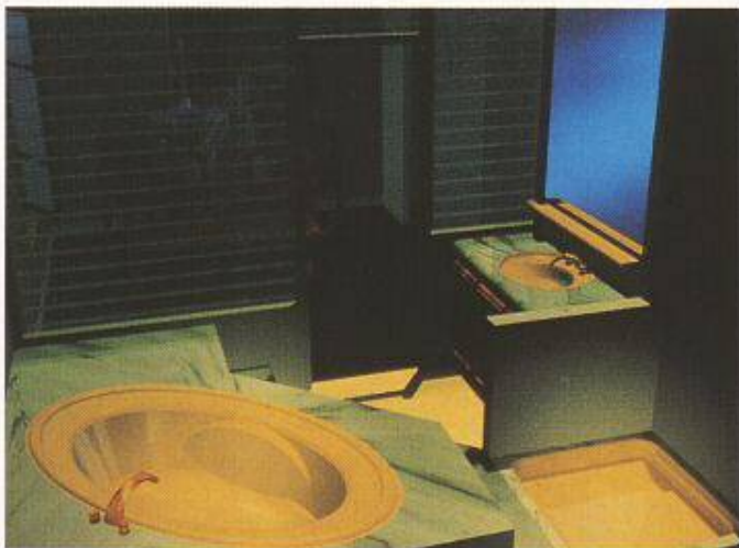
Bild 1. Fotorealistische Darstellungen von architektonischen Situationen sind viel mehr als reine Volumenmodelle...

Hier unterscheiden sich die einzelnen Softwarepakete zum Teil recht stark und reflektieren allzuoft die individuelle Denkart oder auch die praktische Erfahrung des zuständigen Programmierers. Und das ist nicht immer eine sinnvolle Basis. Deshalb ist es mehr als notwendig, dass vor einem Kauf einer 3D-Software dieser digitale Modellbau mit einem praktischen Beispiel von Grund auf erlebt und die Nutzbarkeit des von Software zu Software unterschiedlichen Vorgehens kritisch überprüft wird. Dabei muss nicht nur die erstmalige Eingabe, sondern auch die Veränderbarkeit der einzelnen Volumina, Flächen, Kanten und Punkte kritisch betrachtet werden. Insbesondere muss