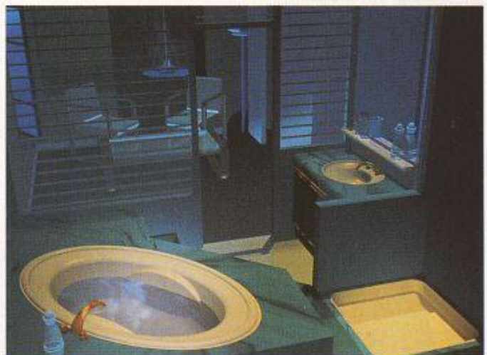
Bild 2. ...Reflexe, Strukturen, Transparenz, gekonnt gesetzte Beleuchtungen usw. machen erst den guten Eindruck