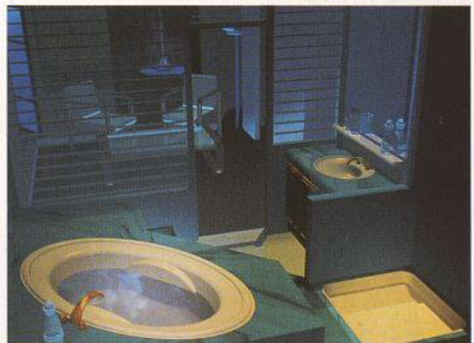
Bild 2. ...Reflexe, Strukturen, Transparenz, gekonnt gesetzte Beleuchtungen usw. machen erst den guten Eindruck