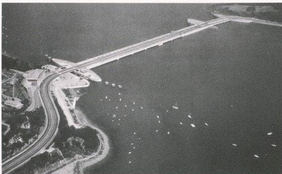
Bild 2. 240 MW-Gezeitenkraftwerk an der Rancemündung in Frankreich. Blick vom Becken Richtung Meer; links die Schiffsschleuse; in der Mitte das Maschinenhaus; rechts das Wehr