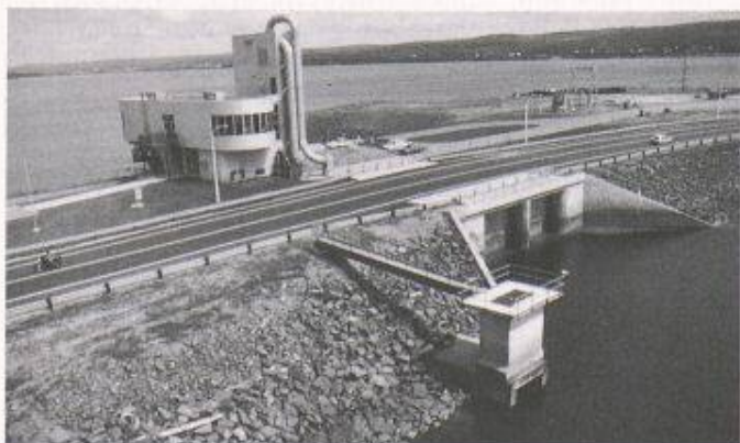
Bild 3. 20 MW-Pilotanlage Annapolis an der Bay of Fundy, Kanada. Blick vom Meer Richtung Becken; Maschinenhaus und Kommandoraum

Schleuse: 1 Kammer mit 13 m x 65 m Nutzfläche