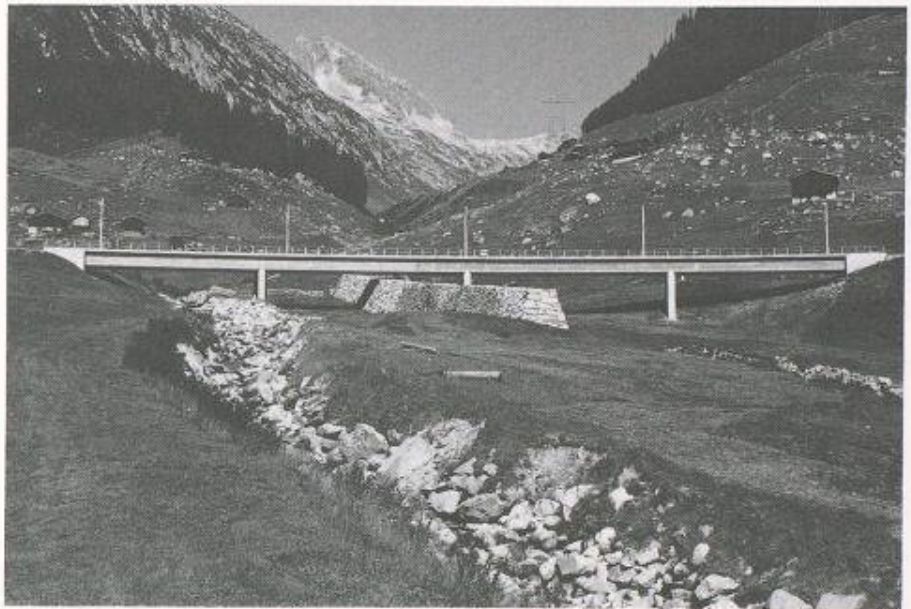
Bild 3. Fertiges Bauwerk

Die Lawinenlast erreicht grössenordnungsmässig etwa gleich hohe Werte