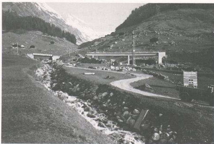
Bild 2. Bauzustand

ger führten zur Ausarbeitung des neuen Projektes.