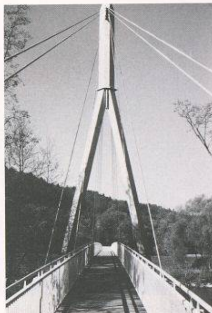
Bild 9. Das fertige Bauwerk von Osten

Schliesslich mussten die ganze Konstruktion gerichtet und die Seile so gespannt werden, dass einerseits die geplante Höhenlage des Steges und andererseits die berechneten Seilkräfte möglichst genau eingehalten werden konnten. Mit schrittweisem Anziehen der Abspann-Muttern an den unteren Seilenden und begleitenden Höhen-Messungen wurde vorerst die geschwungene Nivellette grob eingestellt und anschliessend verfeinert.