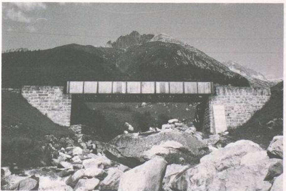
Bild 4. Alte, zu ersetzende Stahlbrücke

wie vertikale Lastkomponenten. Als Vergleich: