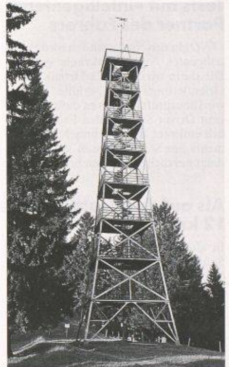
Der hundertjährige Bachtelturm (im Bild noch am alten Standort) wird zurzeit auf dem Pfannenstiel wieder aufgebaut

Die Eröffnung des Turms soll gegen Ende Oktober stattfinden.