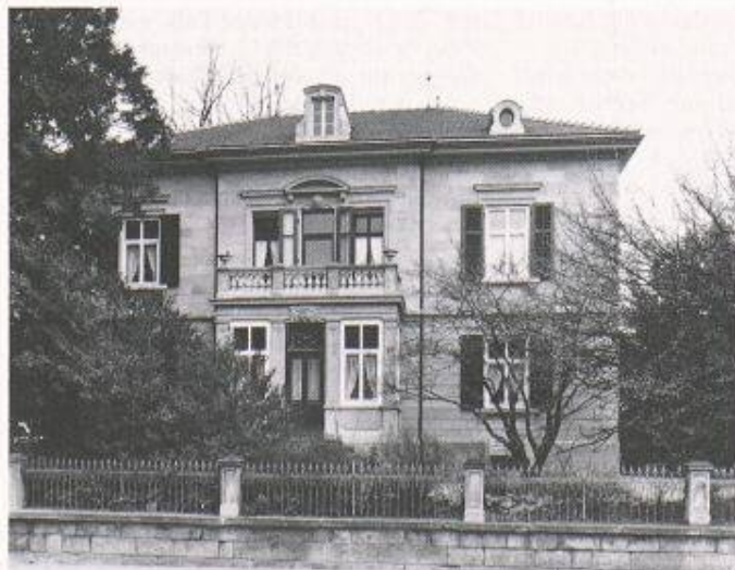
Die vornehme, spätklassizistische Villa Ganz in Embrach (zum Ensemble gehören noch Ökonomiegebäude und Waschküchen) wurde sehr sorgfältig und sanft renoviert

schen Zielsetzung – die möglichst unverfälschte Erhaltung des historischen Dokumentes –, auch die Fülle der neuen Bauvorschriften (Feuerpolizei, Wärmedämmung, Schallschutz usw.) erschwe-