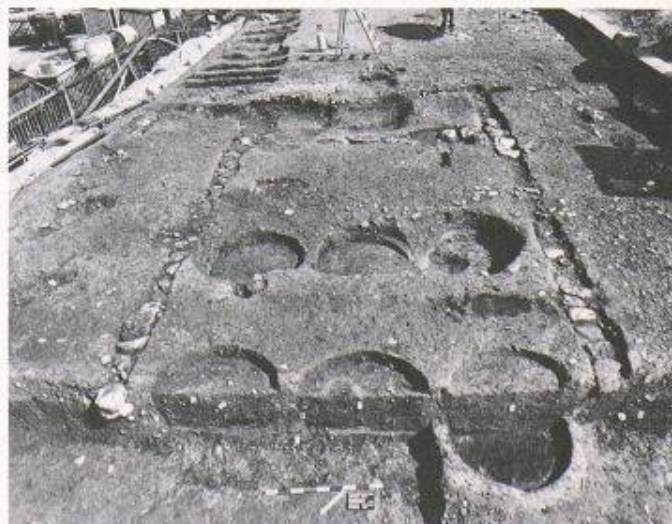
Ausgrabungen an der Römerstrasse in Oberwinterthur brachten Fundamente eines römischen Werkstattgebäudes mit den Vertiefungen von sechs eingegrabenen Fässern zutage