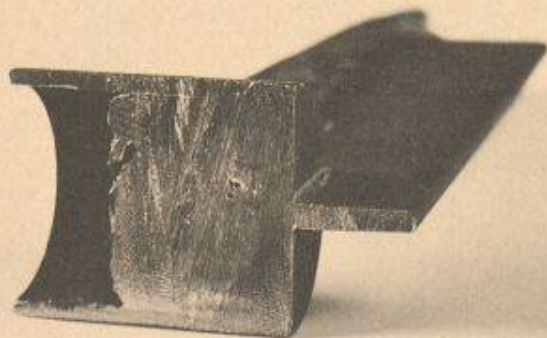
Schnitt durch die Cadwell-Schweissung. Band und Kabel sind molekular fest verbunden.

Bieri Pumpenbau AG 3110 Münsingen Tel. 031/720 90 00