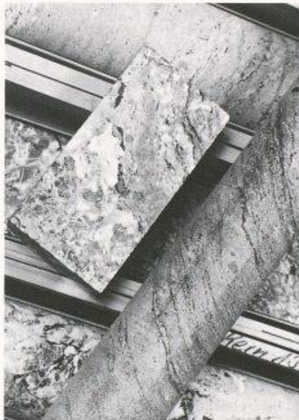
Gesteinsproben vom Bois de la Glaive

Der Bois de la Glaive in den Gemeinden Ollon und Aigle gilt als einer der insgesamt vier potentiellen Standorte zur Endlagerung kurzlebiger radioaktiver Abfälle. Die Bohrkern sind im Winter 1991/92 aus drei Sondierbohrungen gewonnen worden, bei denen auch ein umfassendes geologisches und hydrogeologisches Untersuchungsprogramm durchgeführt wurde. Wie die Nagra (Nationale Genossenschaft für die Lagerung radioaktiver Abfälle) mitteilt, sind die nun angelaufenen ergänzenden Gesteinsanalysen ein weiterer Schritt zur Abklärung der Eignung des Anhydrites als Endlager-Wirtgestein.