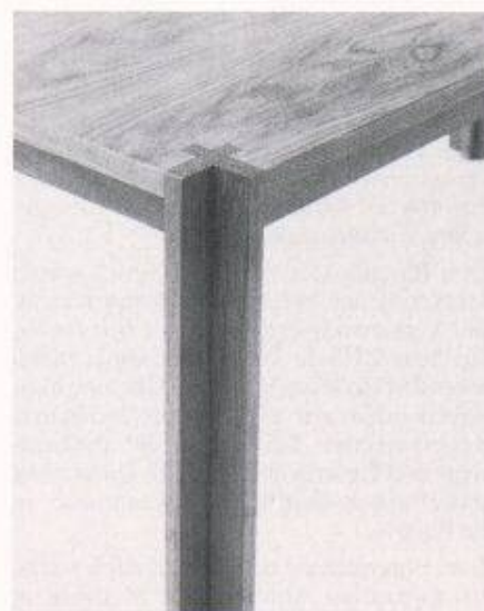
Kreuzelement für horizontale oder vertikale Lage. Der Rahmenbau verlangt Formgleichheit der Füge-teile, um die maschinelle Erstellung zu ermöglichen