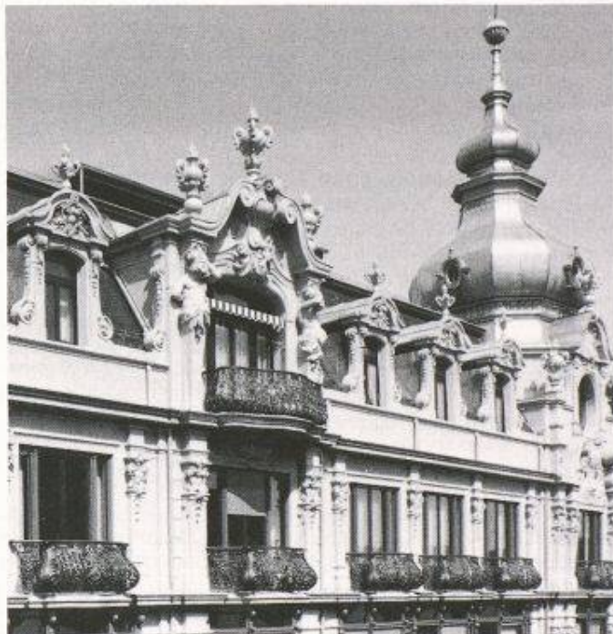
Die ursprünglichen Gussgeländer der Balkone wurden anhand von Fotografien aus der Jahrhundertwende in Aluguss rekonstruiert

Für die Sanierung und Rekonstruktion des Geschäftshauses «Metropol», erbaut im Jahr 1895, verlieh die Pro Re-