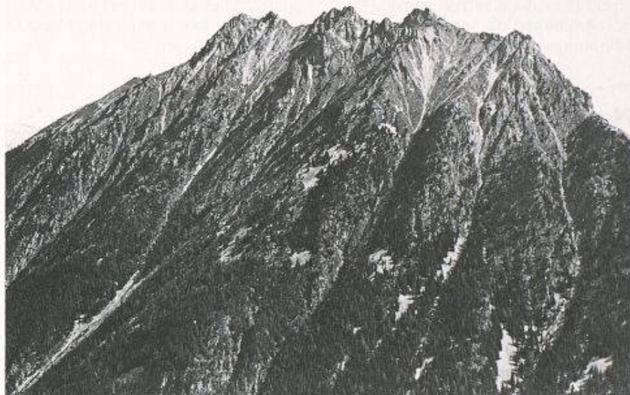
Der durch Lawinengänge und Steinschlagrinnen zerklüftete Gebirgswald «Le Bonhomme» beim Champex, Wallis; (Bild: Walter Schönenberger, WSL)

Die Sektion Landesforstinventar der Eidgenössischen Forschungsanstalt für Wald, Schnee und Landschaft (WSL) in Birmensdorf führt alljährlich die Waldschadeninventur durch. Seit 1985 wird