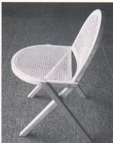
Stuhl, 1955. Ausgeführt in naturfarbigem Avodire-Holz und Juncgeflecht. Sitz und Rückenpartie in Form und Grösse gleich

Der Band enthält die von Werner Blaser selbst präsentierten Arbeiten in themati-