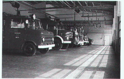
Stabilität für höchste Belastungen