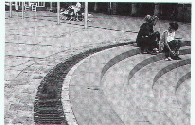
Ästhetik in verkehrsfreien Zonen