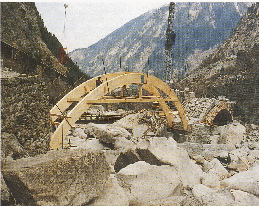
Bild 14. Montage des Lehrgerüsts für den grossen Bogen

auch für die Steingewinnung verantwortlich. Während des Wiederaufbaus brachten die Baufacharbeiter der Arbeitsgemeinschaft ihre Erfahrungen beim Mauern mit dem harten Granit in die Arbeit mit ein; Kenntnisse älterer Mitarbeiter, die fast vergessen waren, wurden wieder reaktiviert und jüngeren Kollegen weitergegeben. Polier Fredy Fallegger rechnete beim Urner Granit mit dem doppelten Bearbeitungsaufwand im Vergleich zum heute weitaus häufiger verwendeten Tessiner Granit, der für die Bearbeitung günstiger strukturiert ist. Das Lehrgerüst für die Bögen wurde unter der Mithilfe von Zimmer-Lehrlingen erstellt.