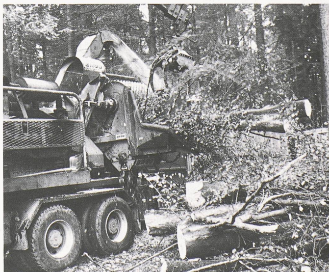
Abfallholz wird direkt im Wald zu Holzschnitzeln verarbeitet, die dann in den Schnitzelöfen verbrannt werden