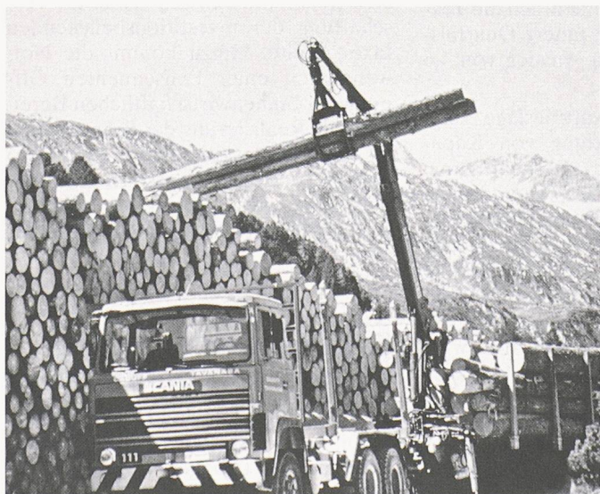
Der neue Computer-Holzmarkt soll den Absatz und die Nachfrage nach Rundholz vereinfachen und so im einheimischen Markt Transparenz schaffen

Die Zukunft liegt bei der Verwertung klar bei den Schnitzelheizungen. Für den Waldbesitzer eröffnen Schnitzelheizungen und Ganzbaumhacker finanziell interessante Perspektiven. Weil Baumkronen samt Ästen gehackt werden können, reduziert sich auch die teure Holzläumung nach dem Schlag (Bild unten r.).