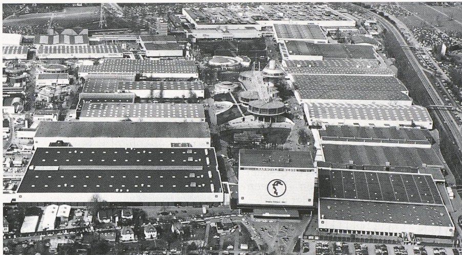
Ein Blick auf das Messegelände in Hannover

(VDI) Ein Bericht des Europäischen Parlamentes hält fest, dass vor allem in Städten die Einführung von Elektroautos unterstützt werden soll. Jährlich müssten mindestens 70 000 Fahrzeuge abgesetzt werden können (Marktanteil von 0,5%), um dem Verbraucher erschwingliche Preise anbieten zu können. 40 an diesem Vorhaben interessierte Städte haben sich bereits zu einem Verband (Citelec) zusammengeschlossen.