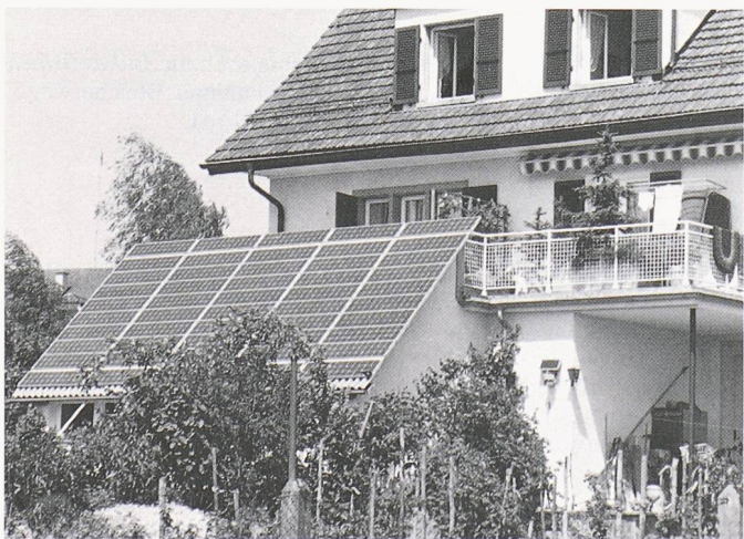
Bild 1. Trapezprofil-System vor einem Wohnhaus in Bassersdorf bei Zürich: Profi-Lösung bei gleichzeitig (relativ) günstigen Gesamtkosten

glasfaserverstärkten Matte liegt. Diese Platte in Sandwich-Bauweise ist weniger als 1 cm stark, die gesamte Bauhöhe allerdings beträgt, wegen der für die Schlagregendichtigkeit notwendigen sogenannten Fuss- und Kopfschlösser, rund 5 cm. 76,6 auf 50,5 cm misst der einzelne Ziegel. In der First-Trauf-Richtung überlappt das Element rund 5,5 cm, wobei dieses Mass wegen der bei den Dachdeckern üblichen Toleranzen bei der Verlegung der Dachlattung variiert. Die auf dem Dach sichtbare Länge des Elementes beträgt demnach 71 cm und überdeckt damit zwei Latenzwischenräume von «genormten» 35 cm. Die verlegten Elemente bilden seit-