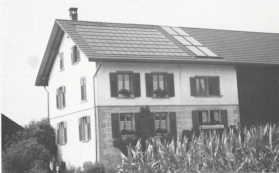
Bild 5. Wohnhaus mit Solardachziegeln – und Wärmekollektoren – in Mönchaltorf

re bei den Fassaden, ist das Angebot von geeigneten Klebstoffen gross. Kleber aus Silikon wurden zur Befestigung von Solarzellen, neben Bändern auf Acrylbasis, am besten bewertet. Bei Versuchen wurden zwei wesentliche Forderungen offenbar. Bei der Verarbeitung des Klebstoffes sind Hohlräume tunlichst zu vermeiden, weil allfällig eindringendes Wasser im Winter – bei Eisbildung – zum Bruch der Zellen führen kann. Zudem ist eine genügende Klebstoffstärke, mindestens 1 mm, zur Aufnahme von thermischen Dehnungen unerlässlich. Dafür könnten Abstandhalter eingesetzt werden. Wenn noch in Rechnung gestellt wird, dass absolut fettfreie Oberflächen notwendig sind, ist der Ratschlag der Berichtverfasser zu verstehen: «Eine zuverlässige Klebung von Solarzellen findet in einem geeigneten Raum und nicht auf der Baustelle statt.»