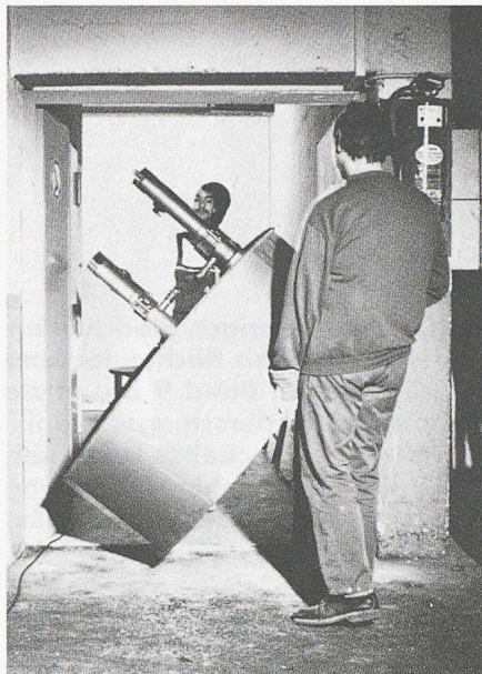
Bild 8. Verringerter Einbau- und Betriebsaufwand durch: leichten Transport der einzelnen Baukomponenten ...

Zusammenfassen ist festzustellen: Trotz aller technischen Weiterentwicklungen auf dem Gebiet der Fettabscheideranlagen hat bisher keines der bekannten Konzepte den Gedanken der Frischfettabscheidung zur Wiederverwertung verfolgt. Ziel muss es jedoch sein, bei Einhaltung der technischen Anforderungen zum Schutz der Abwasserinstallation, der Kanalisation und Kläranlagen, die in Fettabscheideranlagen abgetrennten Fette und Sinkstoffe nicht kostenaufwendig zu beseitigen, son-