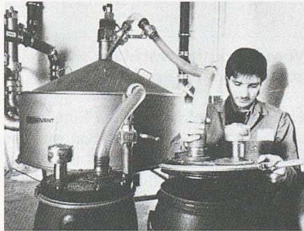
Bilder 10 und 11. ... sowie verminderten Aufwand bei der Entsorgung durch die Verwendung von Kleinsammelbehältern

dern zur Schliessung von Abfallkreisläufen der Wiederverwertung zuzuführen,