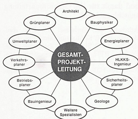
Bild 1. Gesamtprojektleitung

Eine Bauaufgabe ist erfolgreich gelöst, wenn es gelingt, die Ziele und Bedürfnisse des Auftraggebers zu erfüllen und das Bauvorhaben konzeptionell einheitlich, mit dem geforderten Qualitätsstandard, innerhalb der gegebenen Kosten- und Termingrenzen und unter Berücksichtigung der Umwelteinflüsse zu realisieren. Erfolgreiches Projektmanagement hat für den Bauherrn einen hohen wirtschaftlichen Nutzen.