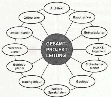
Bild 1. Gesamtprojektleitung

den heute bessere, ganzheitliche Lösungen verlangt, bei denen ausser technischen und wirtschaftlichen Zielsetzungen auch Ziele der Gesellschaft, wie zum Beispiel höchstmögliche Sicherheit, Umweltschutz, Sparsamkeit bei der Verwendung von Rohstoffen usw. beachtet werden müssen. Dazu kommt, dass wegen der erforderlichen Wirtschaftlichkeit und der ständigen Innovationsbestrebungen die Projekte in den vergangenen Jahren ständig grösser und komplexer geworden sind.