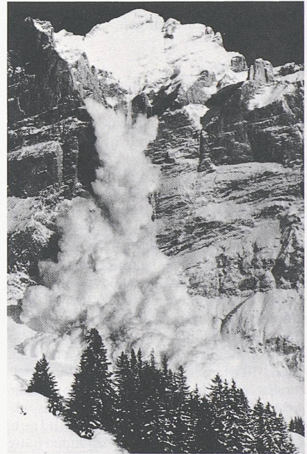
Staublawine am Wetterhorn

Mit Blick auf den kommenden Winter wird erstmals die vereinheitlichte Europäische Lawinengefahrenskala bei der Ausarbeitung der Lawinenbulletins angewendet, die nur noch 5 Gefahrenstufen verwendet. Aber auch in Zukunft nimmt das Lawinenbulletin den Skitouristenführern oder den Chefs der Lawinensicherungsdienste den persön-