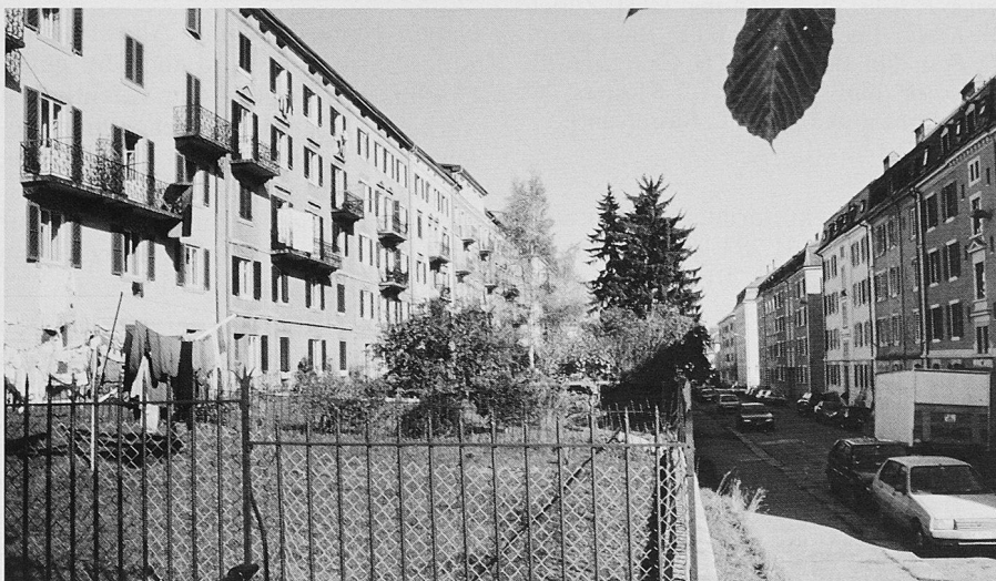
La Chaux-de-Fonds brannte vor genau 200 Jahren fast gänzlich ab. Beim Wiederaufbau folgte man einem Schema aus den Elementen Wohnhaus – gemeinsamer Garten – Strasse und achtete auf gute Besonnung

Der SHS wird den mit 20 000 Fr. dotierten Wakker-Preis im Juni den Stadtbehörden übergeben.