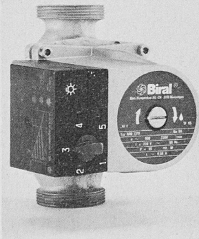
Umwälzpumpe mit integrierter elektronischer Drehzahlregelung

Die Investitionen der Biral im Technologiebereich tragen Früchte: Zwei neue Umwälzpumpenmodelle, Biral-Redline 13TE und 15 TE, konzipiert für Einfamilienhäuser und kleinere