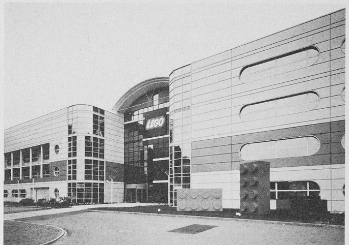
Lego-Produktion AG in Willisau, dessen energieoptimierte Gebäudetechnik von Sulzer Infra federführend ausgeführt wurde

Das Ziel, die Qualität dieser speziellen Bauleistungen sicherzustellen, hat Sika bewogen, das Qualitätssicherungssystem nach ISO 9000/EN 29000 nicht nur für Produktion und Verkauf (1. Zer-